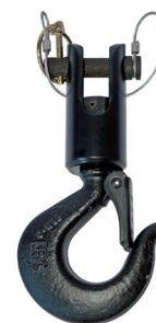
Crochet à chape orientable